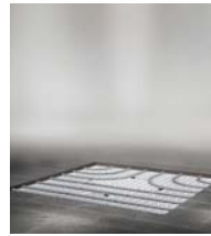
x-net Flächen- heizung/-kühlung