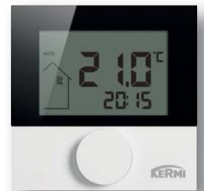
Raumbediengerät mit Display für Bus und Funk