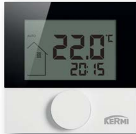
Raumbediengerät mit Display für Bus und Funk