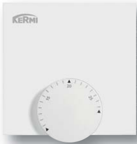
Raumbediengerät ohne Display für Bus und Funk