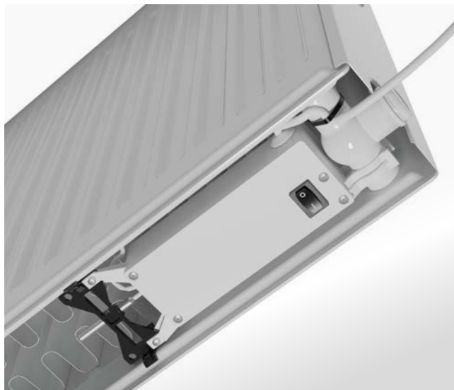
Der Ein-/Ausschalter ist von unten gut erreichbar.

Die gängigen DIN-Anschlussmaße 500 und 900 erfüllt der x-flair Wärmepumpen-Heizkörper. Es gibt ihn in den Ausführungen V und Vplus (außer BL400). Dadurch ist in der Sanierung ein schmutzfreier Tausch ohne Veränderung der Anschlüsse und der Wandbefestigungen möglich. Die Installation ist damit einfach und effizient, sowohl in der Sanierung als auch im Neubau.