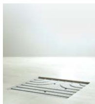
x-net Flächen- heizung/-kühlung